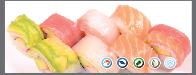
● 103. Urarainbow

anguilla grigliata, asparagi, riso, alghe, salsa teriyaki