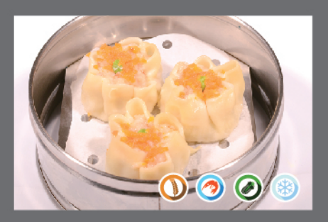
8. Ravioli con gamberi al vapore 3pz

carne suina, verdure, salsa di soia, farina di grano