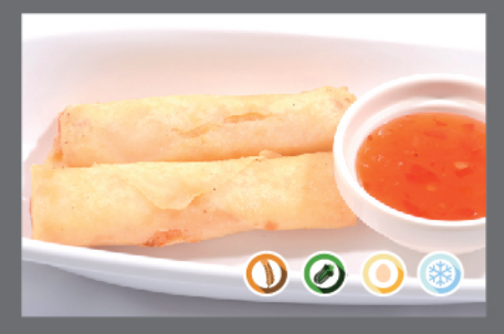
2. Involtini giapponesi 2pz

gamberi, uova, farina di grano, castagne d'acqua