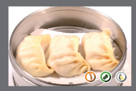
7. Ravioli di carne al Vapore € 3,00 3pz

carne suina, verdure, salsa di soia, farina di grano