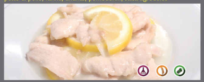
148. Pollo al limone