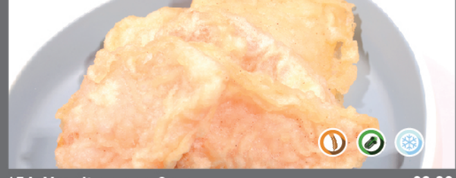
154. Yasaitempura 6pz