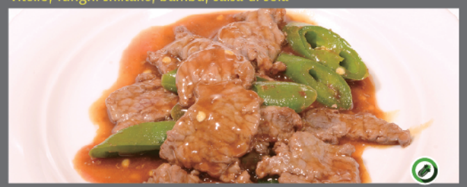
151. Vitello ai peperoni