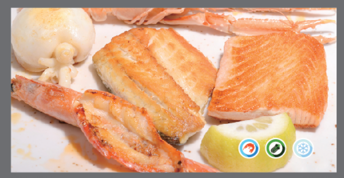
168. Misto mare alla piastra