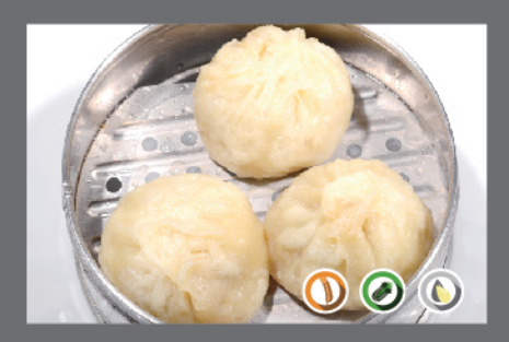
9. Siao long pao

verdure, carne suina, gamberi, castagne d'acqua, salsa di soia