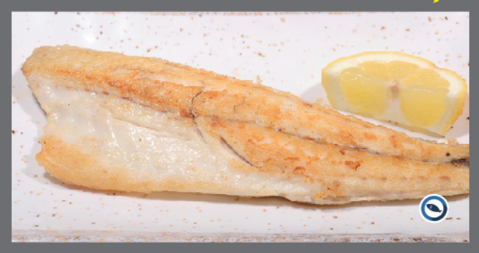
167. Branzino alla piastra