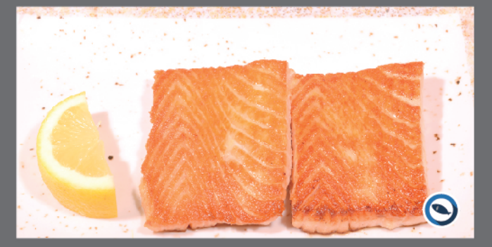
165. Salmone alla piastra 2 pz