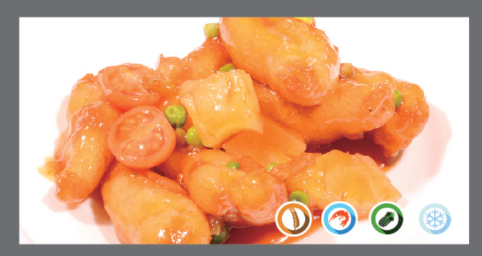
161. Gamberetti in agrodolce